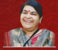
محترمہ انشا چاکر وزیر ثقافت و سیاحت

مدھیہ پردیش اردو اکادمی، سنسکرتی پریشند، حکمہ ثقافت کے زیر اہتمام سلسلہ کے تحت